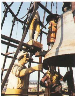
Jaquemart - Lambesc